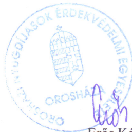
Erős Károly Egyesület elnöke